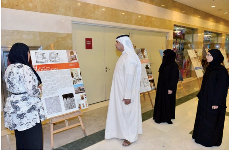
جولة في المعرض

هذا المكان هو أنه قد تحول منذ بداية العقد الماضي من مدرسة، كانت تعد إحدى أقدم وأعرق المدارس الكويتية، إلى متحف للفن الحديث.